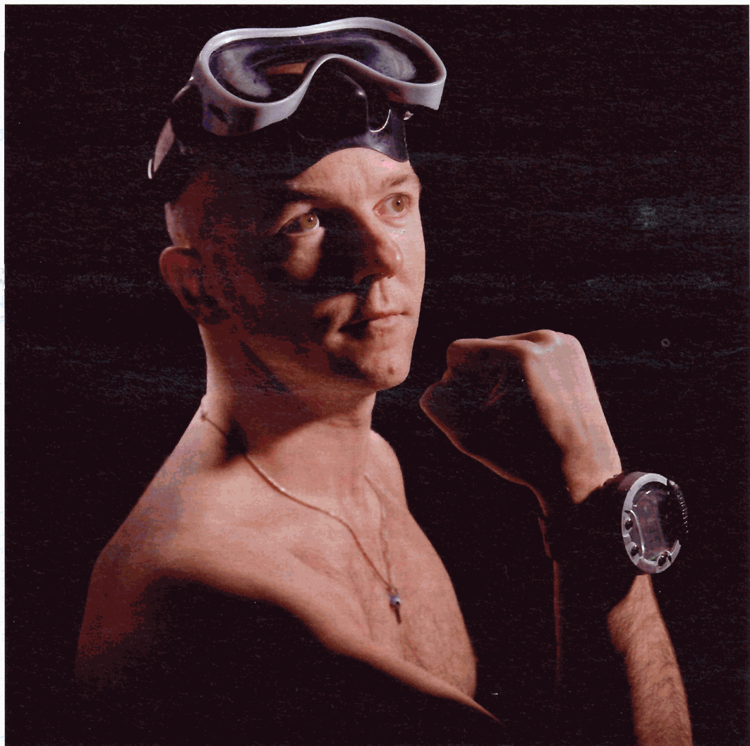
'Het enige waar ik veel geld aan uitgeef, is vakantie en vakantiespullen. Zoals dit duikhorloge van 450 euro'

'Aanvankelijk verdiende ik bij Wisborn minder dan in mijn vorige baan. Dat is inmiddels